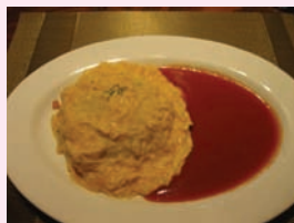
オリエント・カフェ

ランチは、東洋文庫併設の「オリエント・カフェ」。小岩井農場から届いた新鮮な牛乳やバターを使った料理が味わえます。食後は、本郷通りに出て富士神社へ。拝殿は富士山に見立てた山の上にあります。最後は吉祥寺へ。イチヨウ並木が色づいて紅葉真っ盛りでした。紅葉と貴重な文化に触れた楽しいお散歩になりました。