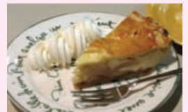
ミッキーズカフェ

■次回のお知らせ 3月17日（土）午前11時 東京メトロ南北線東大前駅 集合 ※飲食代や入場料は全て自己負担になります。 ※雨天中止