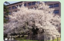
▲岩手から、お礼のハガキが届きました。