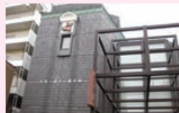
文京ふるさと歴史館