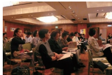
皆さん真剣な表情です。