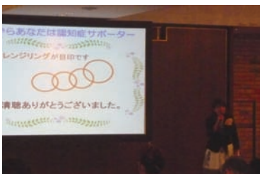
講座の終了です。ご清聴ありがとうございました。