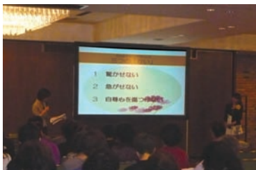
認知症の方への対応の心得、「3つのない」