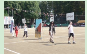
仮装レースの様様です。(残念ながらえびさわの写真はありません)