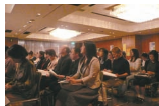
第1部「認知症サポーター講座」