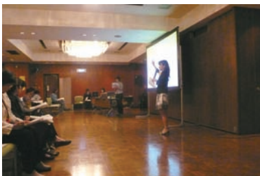
えびさわも、解説のお手伝い。

認知症予防には、毎日の軽い運動と、お茶・野菜・魚をとりましょう。毎日お魚を食べた人と食べない人では、5倍も発生率が違います。