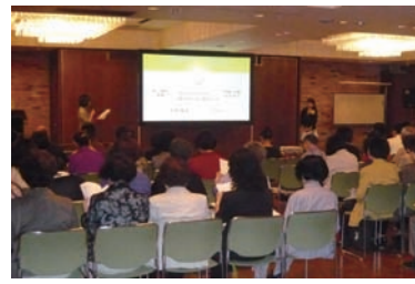
画像を使って判りやすく説明。