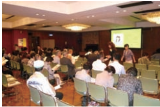
えびさわ、席を廻ってご挨拶。