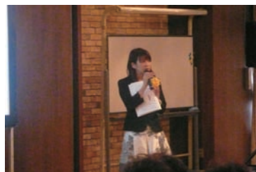
第二部「折り梅」の上映開始です。