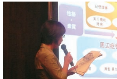
講師の先生もお話に熱が入ります。