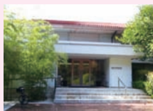
▲講談社野間記念館