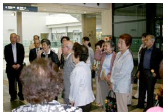
午前9:15シビック1階に 皆さん集合です。