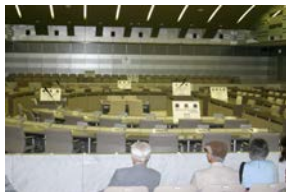
次は委員会室です。 予算などの審議を行います。