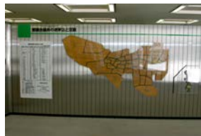
最初は都議会PRコーナーで す。都議会の仕事をパネル やビデオで紹介しています。