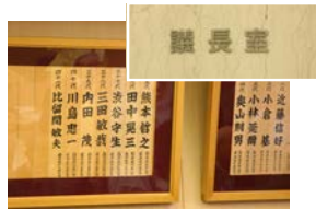
次は議長室です。今回特別 に見学させていただきました。