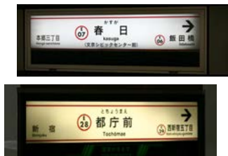
都庁まで大江戸線で 15分で到着です。