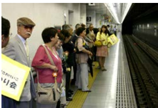
ひまわり会の旗見えますか？ ちょっとした日帰りツアーです。