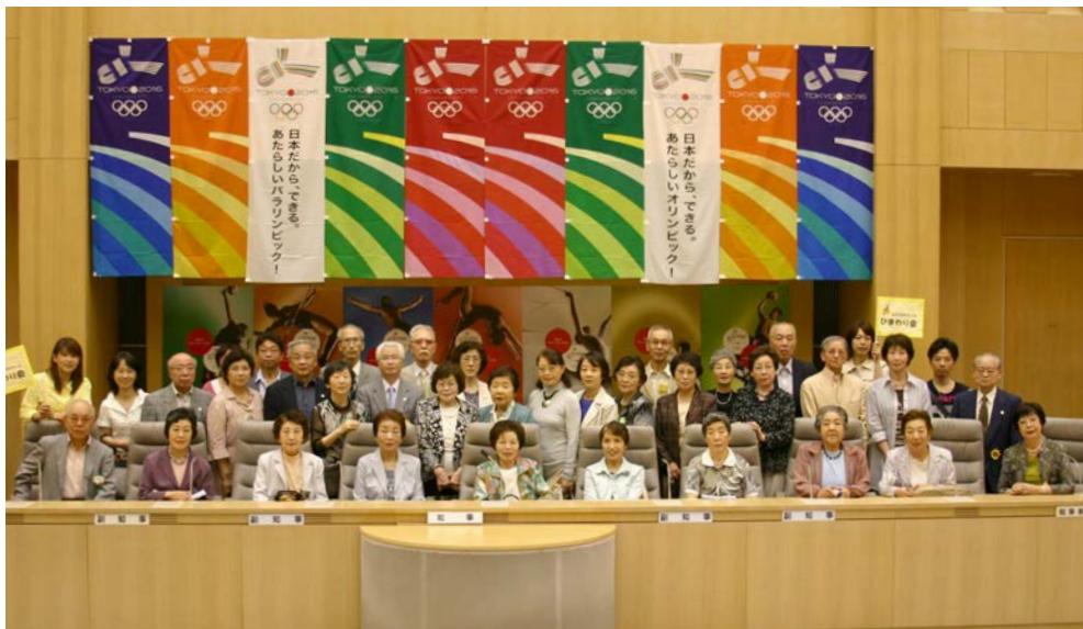
今回もたくさんの方にご参加頂き、楽しく賑やかな一日となりました。