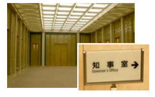
次に知事の接見室です。すご い広さがあって周りはずべて 大理石です。知事が来訪者 と接見される部屋です。