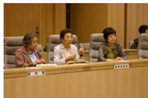
各会派の代表者が、主に議 会の運営方法について協議 します。