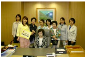
えびさわも皆さんとパチリ