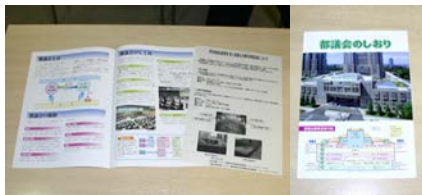
本日は通常の見学コースに加え都議会の議長室と知事の接見室なども見 学させていただきました。