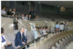
前回見学した文京区の議場 の数倍の広さがあります。