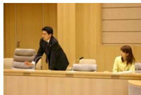
次は議会運営委員会です。