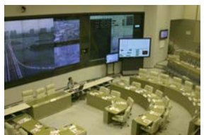
次は東京防災センターで す。