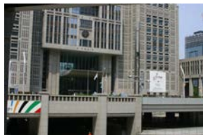
向かい側に第一本庁舎が見えます。丸い窓には東京都のシ ンボルのイチョウの模様が出されます。