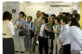
最初は都議会PRコーナーで す。都議会の仕事をパネル やビデオで紹介しています。