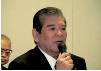
深谷先生がお忙し中 かけつけて下さいました。