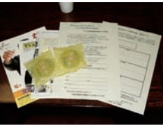
本日の資料と護国寺様から 頂いたお菓子。