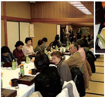
おいしく召しあがっていただけました でしょうか。