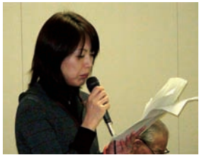
事務局山際より事業報告を行 い、総会終了です。