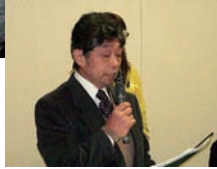
本日も司会は大吉さん。