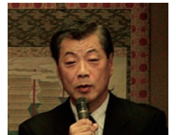
ぼけ防止協会の成井事務局 長からご挨拶を頂きました。