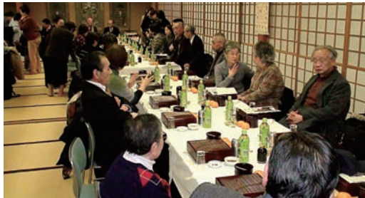
新年区政報告会のスタートです。