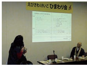
事務局乙部よりプロジェクターを使い、 会計の報告を行いました。