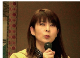
えびさわ議員より区政報告 がありました。(詳細裏面)