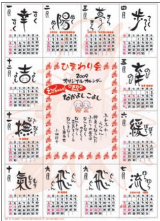
ひまわり会カレンダー