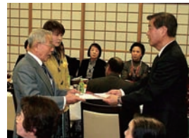
皆様からの募金を「ぼけ防止 協会」さんに贈呈しました。