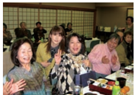
ゲームは福引大会です。景品はたくさんの方々からご提供 いただきました。ありがとうございました。