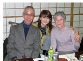
景品が当たった方に、えびさわが配って回って 記念撮影を「パチリ」。